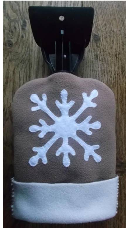
Dos du gant

Pour cet ouvrage, l'emploi d'un tissu polaire est conseillé car il a en l'occurrence un double avantage :