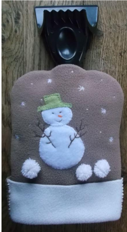
Devant du gant

L'appliqué perse est une technique qui permet d'appliquer des motifs imprimés complexes. Le chintz avec ses imprimés très travaillés est l'exemple typique de tissu utilisé : on y découpe des motifs choisis très détaillés (oiseaux, bouquets, fleurs ...) que l'on agence à notre convenance sur un tissu de fond. Les pièces de la composition sont ensuite fixées à bord vif sur le support par des points de feston pour éviter leur effilochage.